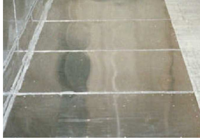
Mu-metal로 만들어진 Aaronia Magnoshield® 로 넓은 지역을 아주 쉽고 빠르게 자기장 스크리닝 할 수 있다.