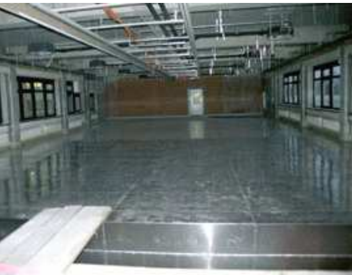
Aaronia Magnoshield® 스크리닝 판넬을 이용한 사무실 빌딩의 넓은 공간을 낮은 레벨의 변압기 기지로부터 스크리닝

설치 후, Aaronia MagnoShield® 판넬은 회벽으로 덮거나 페인트로 칠할 수도 있다. 따라서 보이지 않게 설치하는도 문제 없다.